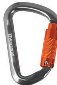
MOSQUETÓN ALUMINIO - "D" 596 93 62-12