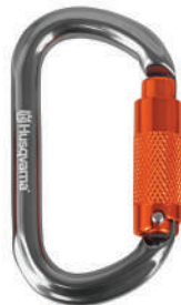
MOSQUETÓN ALUMINIO - OVALADO 596 93 62-11