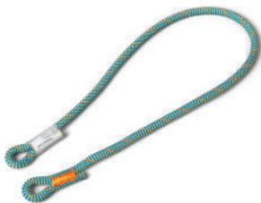
PRUSIK 534 09 99-01