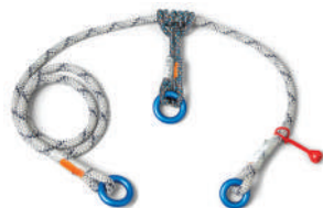
SALVA CAMBIUM 534 09 92-01