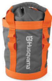
BOLSA PARA CUERDA 596 93 63-11