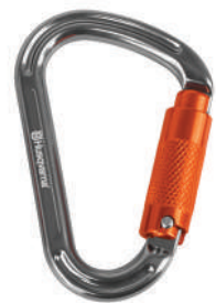
MOSQUETÓN ALUMINIO - HMS 596 93 62-13