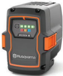
BATERÍA 40-B330X 970 60 77-01