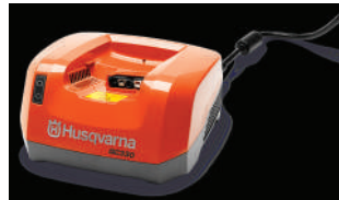
CARGADOR DE BATERÍA HUSQVARNA QC330 966 73 06-01