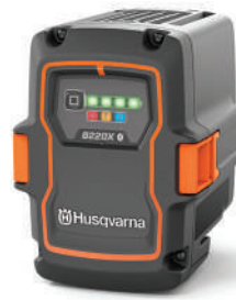
BATERÍA 40-B220X 970 60 78-01