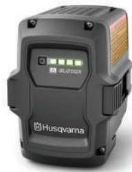
HUSQVARNA BATERÍA BLI200X 970 44 89-01