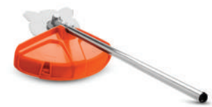
DESBROZADORA BCA850 967 18 59-02