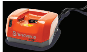
CARGADOR BATERÍA QC330 970 52 22-01