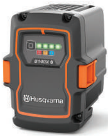
BATERÍA 40-B140X 970 60 79-01