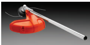
RECORTADORA TA850 537 35 35-03