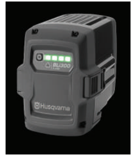
HUSQVARNA BATERÍA BLI300 967 07 19-01