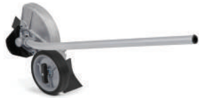
RECORTADORA TUBO CURVO ECA850 967 92 55-04