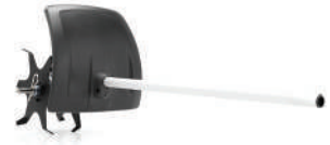
CULTIVADOR CA230 967 29 42-01