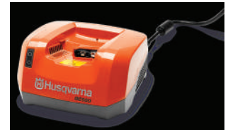
CARGADOR QC500 970 44 95-01