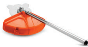
HUSQVARNA DESBROZADORA (BCA850) 967 18 59-01