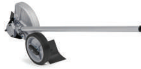
RECORTADORA TUBO RECTO ESA850 967 92 56-04