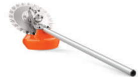
HUSQVARNA ACCESORIO RECIPROCATOR RA850 967 90 85-01