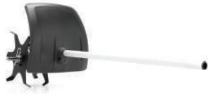
CULTIVADOR CA230 967 29 42-01