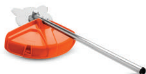
DESBROZADORA BCA850 967 18 59-02