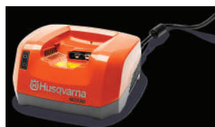
CARGADOR DE BATERÍA HUSQVARNA QC330 966 73 06-01