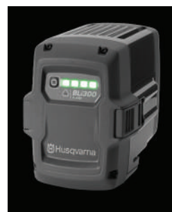
HUSQVARNA BATERÍA BLI300 967 07 19-01