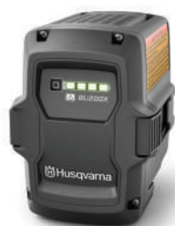
HUSQVARNA BATERÍA BLI200X 970 44 89-01