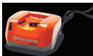
CARGADOR BATERÍA QC330 970 52 22-01