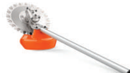
HUSQVARNA ACCESORIO RECIPROCATOR RA850 967 90 85-01