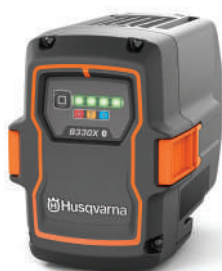
BATERÍA 40-B330X 970 60 77-01