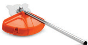
HUSQVARNA DESBROZADORA (BCA850) 967 18 59-01