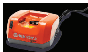
CARGADOR QC500 970 44 95-01