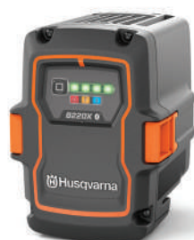
BATERÍA 40-B220X 970 60 78-01