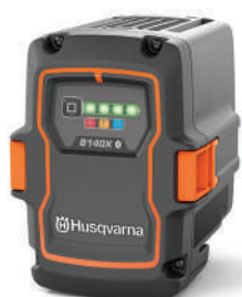
BATERÍA 40-B140X 970 60 79-01