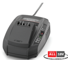
CARGADOR ASPIRE™ 18-C70 970 60 10-01