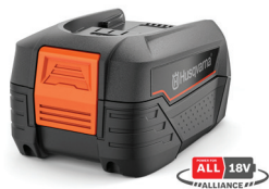
BATERÍA ASPIRE™ 18-B72 - 4AH 970 60 09-01