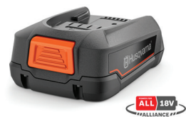
BATERÍA ASPIRE™ 18-B45 - 2,5AH 970 60 08-01