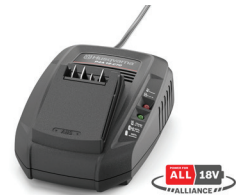
CARGADOR ASPIRE™ 18-C70 970 60 10-01