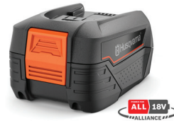
BATERÍA ASPIRE™ 18-B72 - 4AH 970 60 09-01