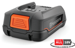
BATERÍA ASPIRE™ 18-B45 - 2,5AH 970 60 08-01