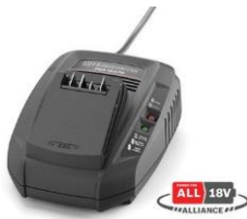
CARGADOR ASPIRE™ 18-C70 970 60 10-01