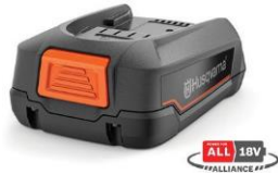
BATERÍA ASPIRE™ 18-B45 - 2,5AH 970 60 08-01