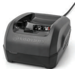
HUSQVARNA CARGADOR QC250 967 97 01-01