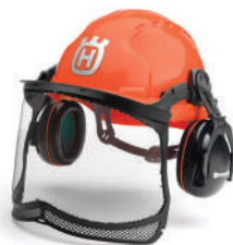
CASCO FORESTAL, CLASSIC 580 75 43-01