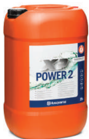
GASOLINA XP® POWER 2T 583 95 29-02