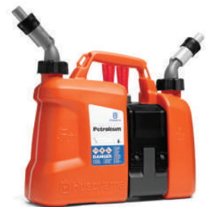
BIDÓN COMBI 5 LITROS 580 75 42-01