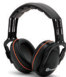
PROTECTOR AURICULAR 505 66 53-04