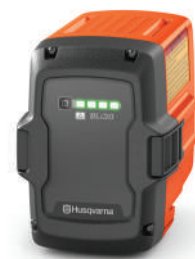
HUSQVARNA BATERÍA BLI30 967 93 77-01