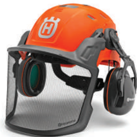
CASCO FORESTAL, TECHNICAL 585 05 84-01