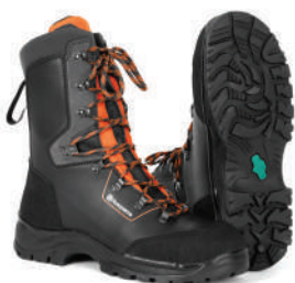
BOTAS SEGURIDAD CLASSIC 20 597 65 94-39