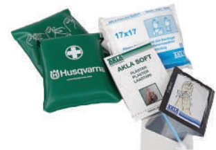
KIT DE PRIMEROS AUXILIOS 504 09 53-01