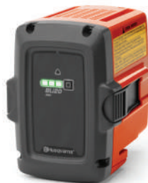
HUSQVARNA BATERÍA BLI20 967 09 17-01