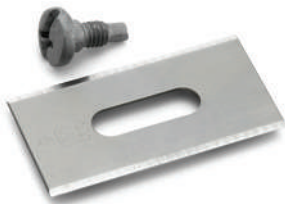
CUCHILLAS ENDURANCE AUTOMOWER® 595 08 44-02