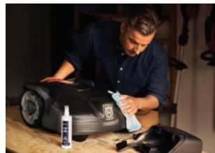
KIT DE MANTENIMIENTO Y LIMPIEZA 590 85 51-01