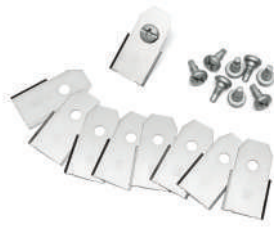
CUCHILLAS AUTOMOWER® 577 86 46-03