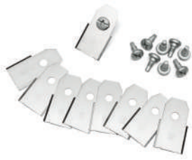
CUCHILLAS AUTOMOWER® 577 60 65-05