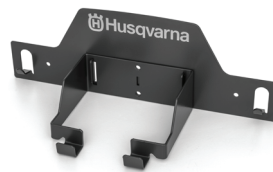
SOPORTE DE FIJACIÓN MURAL 585 01 97-02