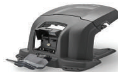
CASETA AUTOMOWER® 587 23 61-01