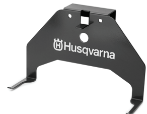
SOPORTE DE FIJACIÓN MURAL 587 22 40-01