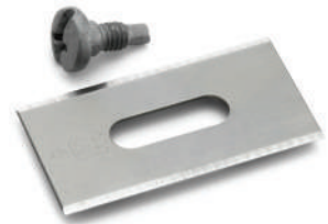
CUCHILLAS ENDURANCE AUTOMOWER® 595 08 44-01