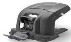
CASETA AUTOMOWER® 585 01 94-01