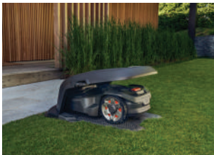
CASETA PARA ROBOT CORTACÉSPED ASPIRE™ R4 536 66 18-01