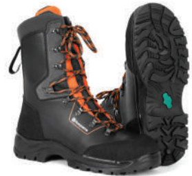
BOTAS SEGURIDAD CLASSIC 20 597 65 94-47