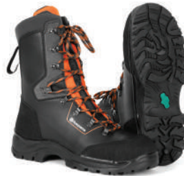
BOTAS SEGURIDAD CLASSIC 20 597 65 94-46