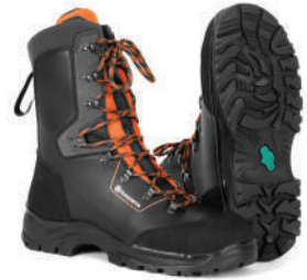
BOTAS SEGURIDAD CLASSIC 20 597 65 94-43