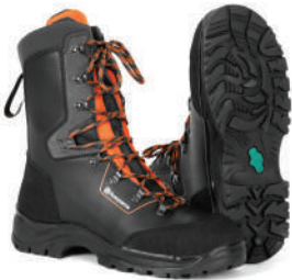
BOTAS SEGURIDAD CLASSIC 20 597 65 94-44