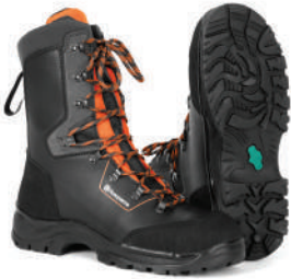
BOTAS SEGURIDAD CLASSIC 20 597 65 94-40