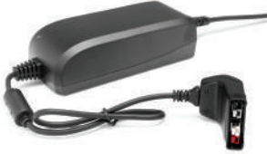
HUSQVARNA CARGADOR QC80 967 33 56-31