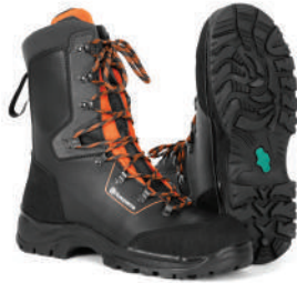
BOTAS SEGURIDAD CLASSIC 20 597 65 94-41