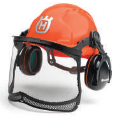
CASCO FORESTAL, CLASSIC 580 75 43-01