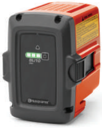
HUSQVARNA BATERÍA BLI10 967 09 16-01