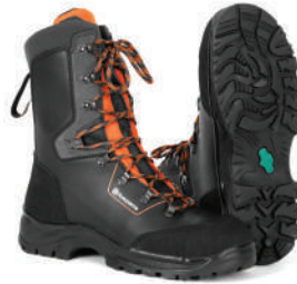
BOTAS SEGURIDAD CLASSIC 20 597 65 94-42