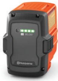
HUSQVARNA BATERÍA BLI30 967 93 77-01