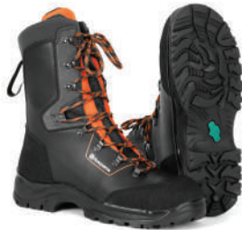
BOTAS SEGURIDAD CLASSIC 20 597 65 94-45