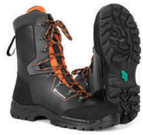
BOTAS SEGURIDAD CLASSIC 20 597 65 94-39