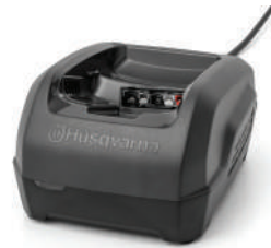
HUSQVARNA CARGADOR QC250 967 97 01-01