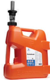
BIDÓN COMBUSTIBLE 580 75 45-01