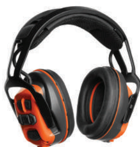
PROTECTORES AURICULARES X-COM R 595 08 40-01