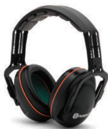
PROTECTOR AURICULAR 505 66 53-04