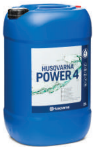
GASOLINA XP® POWER 4T 583 95 59-02