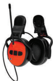
AURICULARES PARA CASCOS CON RADIO FM 578 27 49-04