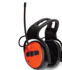
PROTECTOR AURICULAR CON RADIO FM 578 27 49-03