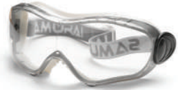
GAFAS DE PROTECCIÓN, GOGGLES 544 96 39-01