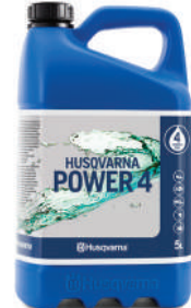
GASOLINA XP® POWER 4T 583 95 59-01