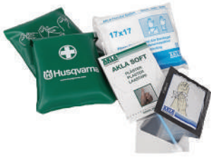
KIT DE PRIMEROS AUXILIOS 504 09 53-01